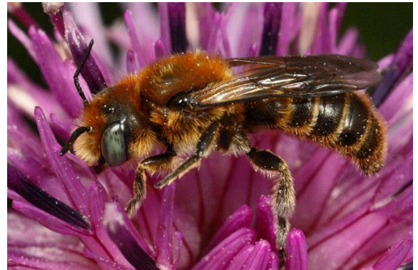
Nattertkopf-Mauerbiene ( Osmia adunca )

Die jetzige Veröffentlichung stellt einen Teilschritt umfangreicher laufender Auswertungsarbeiten dar, die auch aktuelle Untersuchungen in weiteren Gebieten einbeziehen.