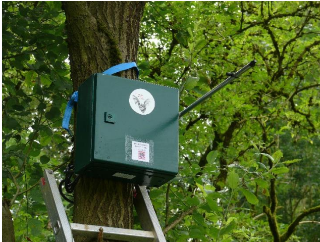
Kontinuierlicher Detektor im Wald