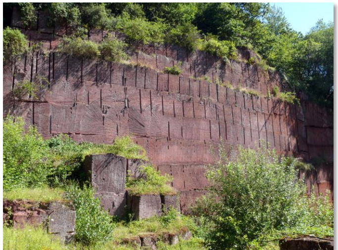
Steinbruch Michelnau / Nidda

Der Steinbruch Michelnau ist in Europa einmalig in seiner Art. Er ist eingebettet im größten Vulkangebiet Mitteleuropas, dem Vogelsberg. Der Vulkan „Vogelsberg“ entstand in der Zeit des Tertiärs vor ca. 19-15 Mio. Jahren und hat mit seinem blaugrauen Basalt unsere Region geprägt. In diesem Zeitraum entstand auch das Michelnauer Vorkommen am Wingertsberg. Das rote Michelnauer Gestein ist durch einen Schlackenvulkan entstanden und ist in seiner Farbe und Struktur in Europa einzigartig. Der Michelnauer Stein wurde in Blöcken aus der Wand gesägt und z.B. zu Fassadenplatten und Kunstwerken weiter verarbeitet. Verbliebene Abbauspuren, Gebäude, Maschinen und Geräte zeugen von der Arbeit, die hier seit Mitte des 19. Jahrhunderts geleistet wurde. Als der Abbau um 1990 langsam zum Erliegen kam, hat sich die Natur den Steinbruch zurück erobert. So finden Sie heute eine reiche