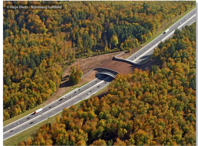
A3 Grünbrücke im Rohrbrunner Forst Oktober 2017

Bei der vorliegenden Planung der Grünbrücke über die A3 erfolgte diese notwendige Abstimmung mit anderen Planungen offensichtlich nicht. Denn durch den geplanten Bau von sechs WEA, die im unmittelbaren Funktionsbezug zur Grünbrücke liegen, ist deren Wirksamkeit für die Zielarten Wildkatze und Rothirsch erheblich und nachhaltig