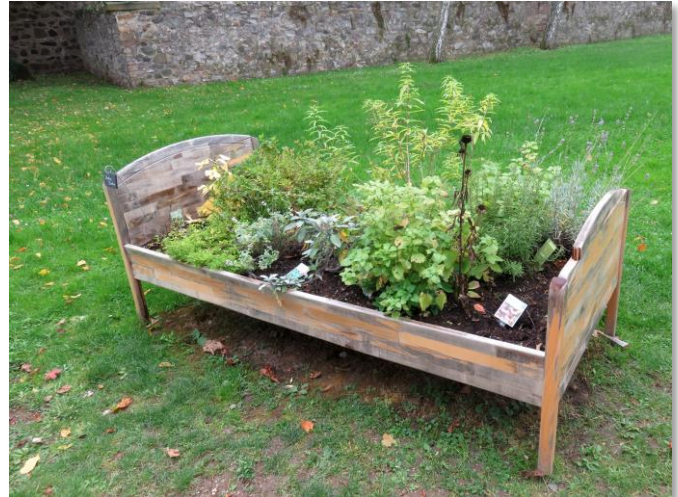
Eine interessante Idee

Ein bis zu 80%iger Rückgang dieser Tiere wird verzeichnet. Weshalb das Insektensterben so plötzlich eingetreten ist, kann bisher keiner so genau sagen. Es werden Vermutungen angestellt, wie der Klimawandel und/oder der Einsatz von Pflanzenschutzmitteln in der Landwirtschaft. Tatsächlich vollzieht sich der Rückgang schon seit mehreren Jahren. Man hat ihn aber noch nicht so drastisch wahrgenommen. Jetzt wird versucht, mit vielen guten Projekten und einer breiten Öffentlichkeitsarbeit, die Artenvielfalt der Insekten zu erhalten und zu fördern. Doch nicht nur andere müssen etwas dafür tun. Jeder kann sich einbringen und wenn es nur ein kleiner Blumenkasten auf dem Fenstersims ist, der ein paar Bestäubern Nahrung bietet. Viele Gärten sehen aus wie aus dem Bilderbuch. Leider bietet das schöne Wohnen im Garten mit kurz geschorenem Rasen und kaum blühenden Blumen den Insekten wenig Lebensraum. Dabei kann es so einfach sein, etwas zu tun. Mit ein